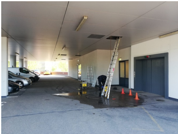
De RRS is druk bezig om via het parkeerdek bij de verstopping te komen.

Doe gebruikt vet waar u vanaf wilt in een lege fles of drankenpak en deponeer het in de speciale container in onze containerruimte. U voorkomt daarmee een hoop ellende, schade en ook extra kosten, want iedere keer moeten twee bedrijven komen opdraven om de rotzooi op te ruimen: de RRS om de leidingen te ontstoppen en Verkerk om alles weer schoon te maken. Zonde van het (ons) geld, toch?