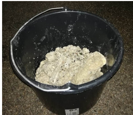
Deze vetmassa werd in januari 2020 uit de leiding gehaald.